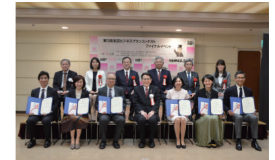
〈前回のファイナルイベントの様子〉