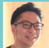
株式会社 岩淵家守舎