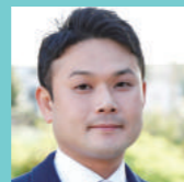
株式会社 さくら総合福祉