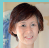
株式会社 ぷらっとマルシェ