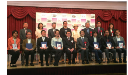
〈昨年度のファイナルイベントの様子〉