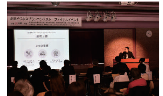
〈昨年度のファイナルイベントの様子〉